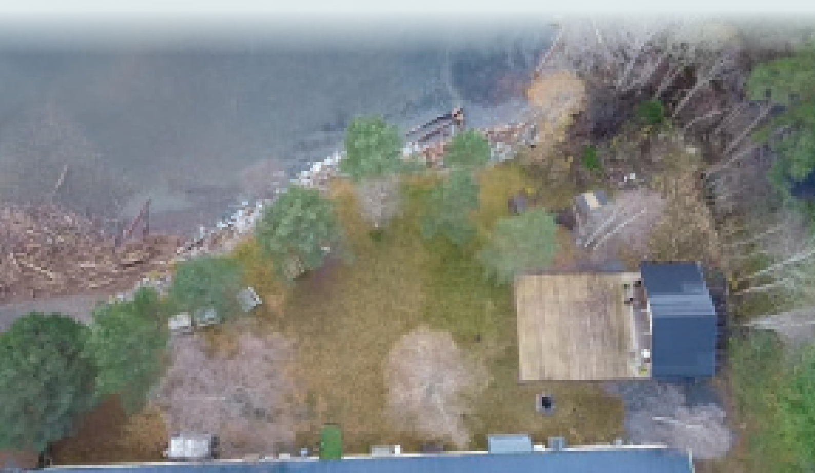
Dronefoto Groparken Groscena

Denne skal innreiast som hola til sjøormen.