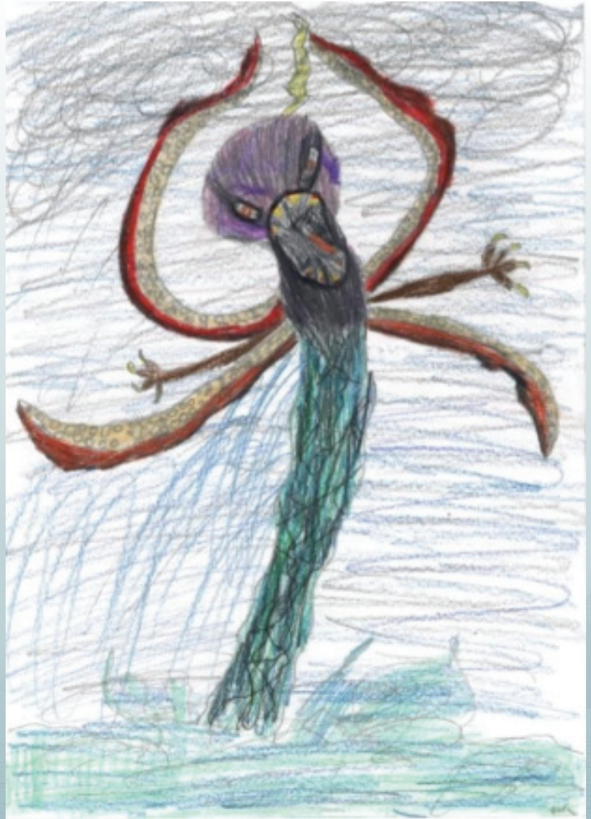
Ein av vinnarane i sjøormkonkurransen.

Vi treng alle slike påminningar knytt til miljø- og naturvern, og ved å kople dette til både historiske, så vel som mytiske perspektiv vil det vonleg både underhalde og fenge, og ikkje minst skape refleksjon og ettertanke. Og vi treng både å bli engasjerte og reflekterte i kampen for miljøet vårt!