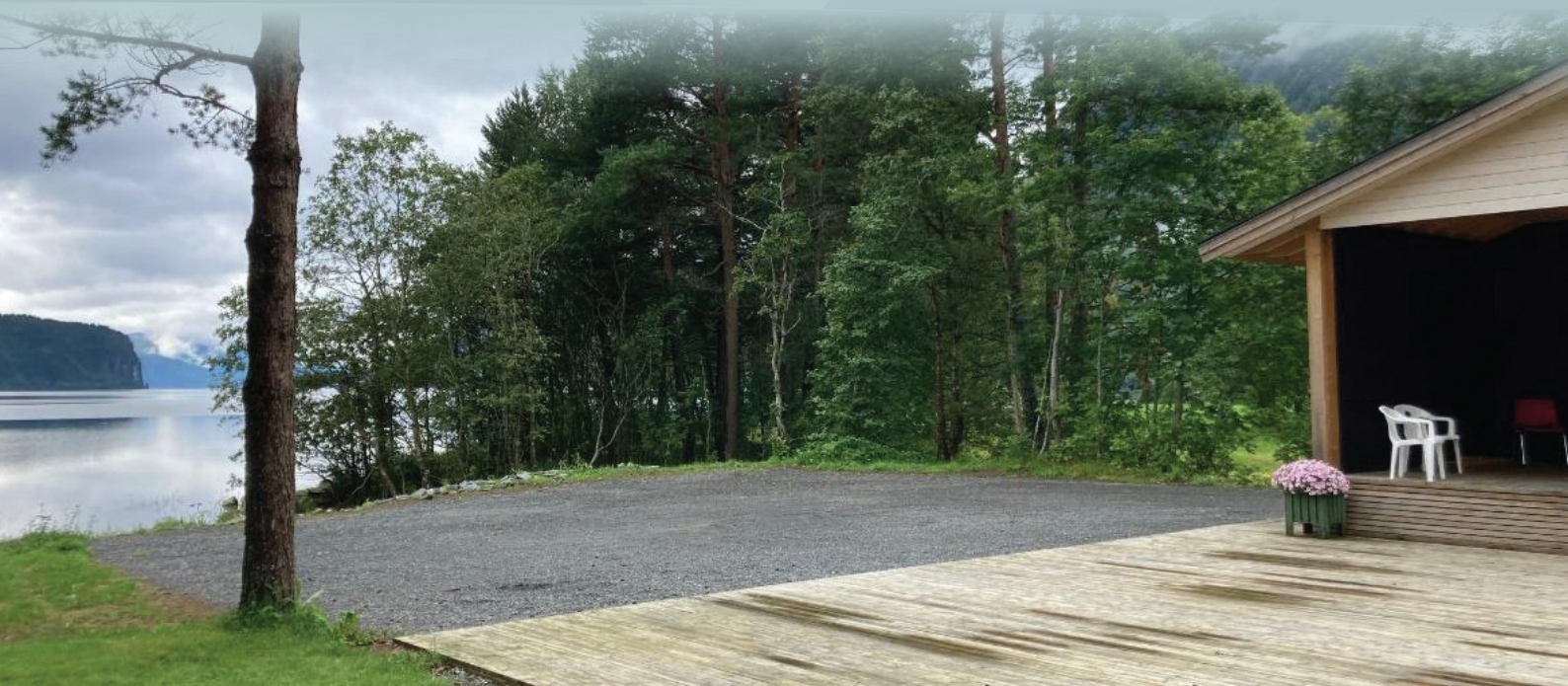
Anlegg med utsyn til Hornindalsvatnet

Prosjektet vert gjennomført i samarbeid med fleire aktørar, blant anna Foreininga «Grobygget», som for tida er inne i ein stor prosess med revitalisering av anlegget sitt som vil vere lokasjonen der spelet skal halde stad. Anlegget deira ligg heilt ved vasskanten av Hornindalsvatnet, med scene og ein koseleg park tilgjengeleg.